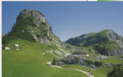
Mauritzalm mit Gschöllkopf