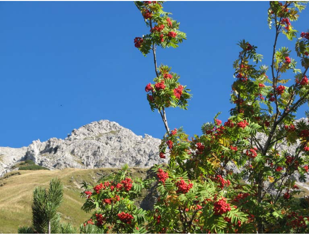
Herbst in den Allgäuer Alpen