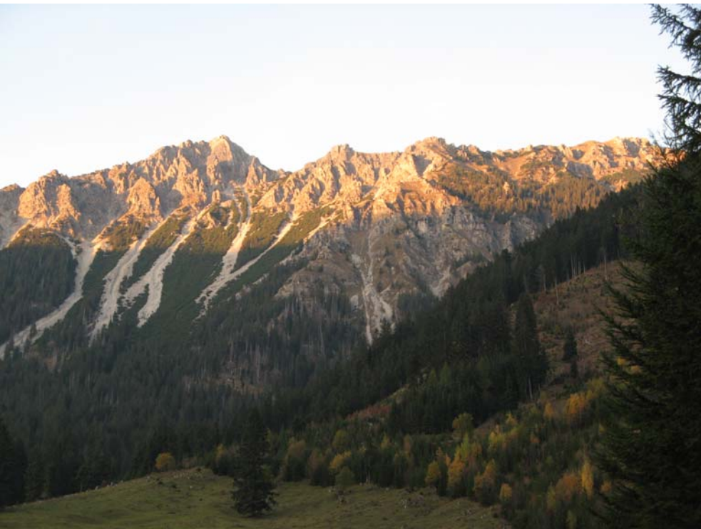
Blick vom Hinterstein auf die Tagestour