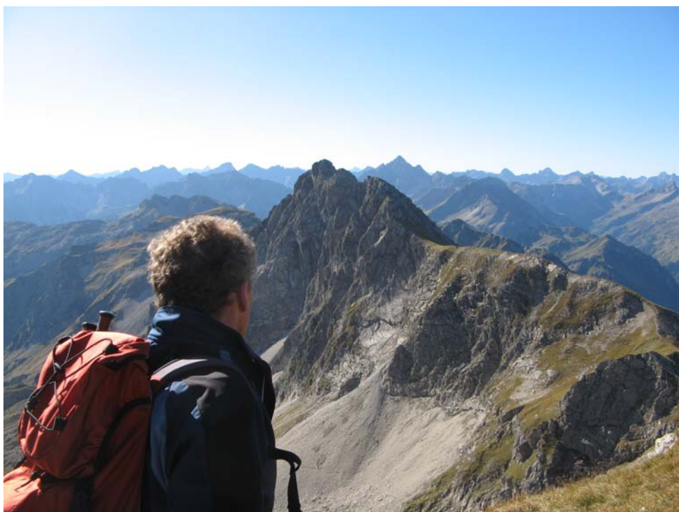
Blick auf Rauhorn

Die Wandergruppe konnte den 2.043 m hohen Ponten über das Zirleseck erreichen, während die Tourengerer das herrliche Bergwetter nutzten und das Gaishorn, sowie das nebenstehende Rauhorn bestiegen. Die beiden 2.249 m hohen Gipfel boten einen grandiosen Rundblick.