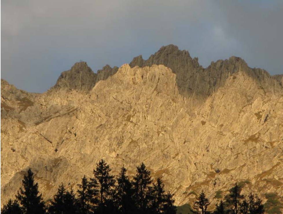
Blick auf Tagestour am Abend

Leichte Klettereien auf dem Weg zu beiden Gipfeln machten den Auf – und Abstieg interessant und wurden problemlos gemeistert. Beim gemeinsamen Treffen auf der Willersalpe genoss man noch die letzten Sonnenstrahlen, bevor es die restlichen 600 m in Tal ging.