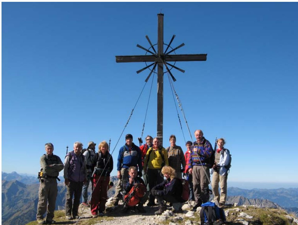
Tourengruppe auf dem Rauhorngipfel

22 Bergsteiger-Bergwanderer fuhren nach Hinterstein/Hindelang um von der Willersalpe auf das Gaishorn und Rauhorn zu steigen.